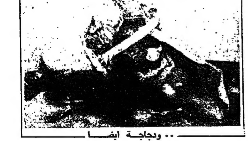
.. وبجاجة ايضا